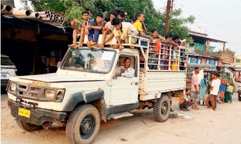
दोरनापाल। सुकमा में मुख्यमंत्री कार्यक्रम में जगरगुंडा, तारलागुंडा, कांकेरलका, बुर्कापाल और चितलनार जैसे दूरस्थ और संवेदनशील क्षेत्रों से ग्रामीणों को पिकअप वाहनों में भरकर कार्यक्रम स्थल तक लाया गया। भीषण गर्मी और तेज धूप के बीच कई ग्रामीणों को खड़े-खड़े सफर करना पड़ा। इस दौरान महिलाओं और बुजुर्गों को परेशानी हुई।